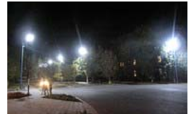
ДЕКОРАТИВНЕ ОСВІТЛЕННЯ БУДІВЕЛЬ